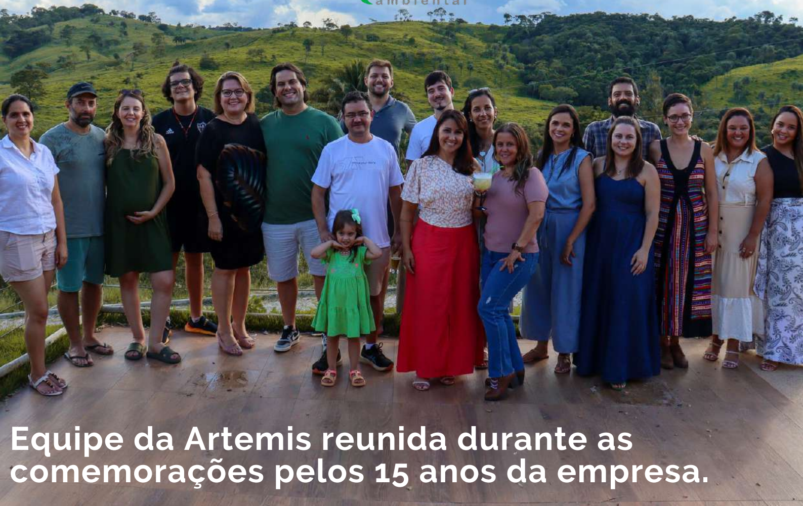
Equipe da Artemis reunida durante as comemorações pelos 15 anos da empresa.

Conheça mais sobre o nosso trabalho e nossa equipe acessando nosso site e seguindo nossas redes sociais.